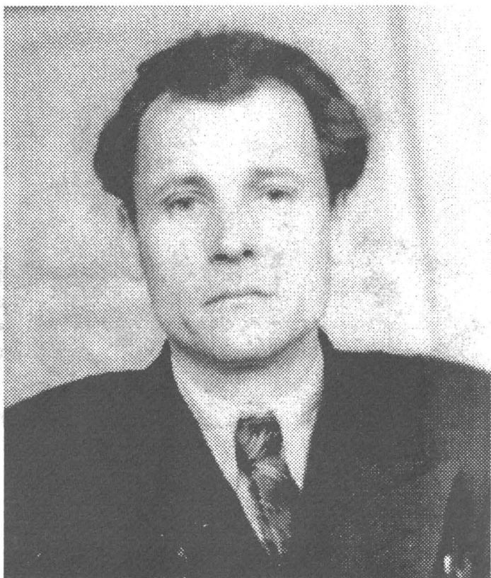
На доске почёта в Прокопьевском горном техникуме, 1954 год.