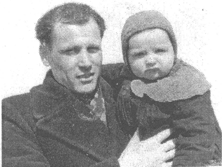
С сыном, 1955 год.