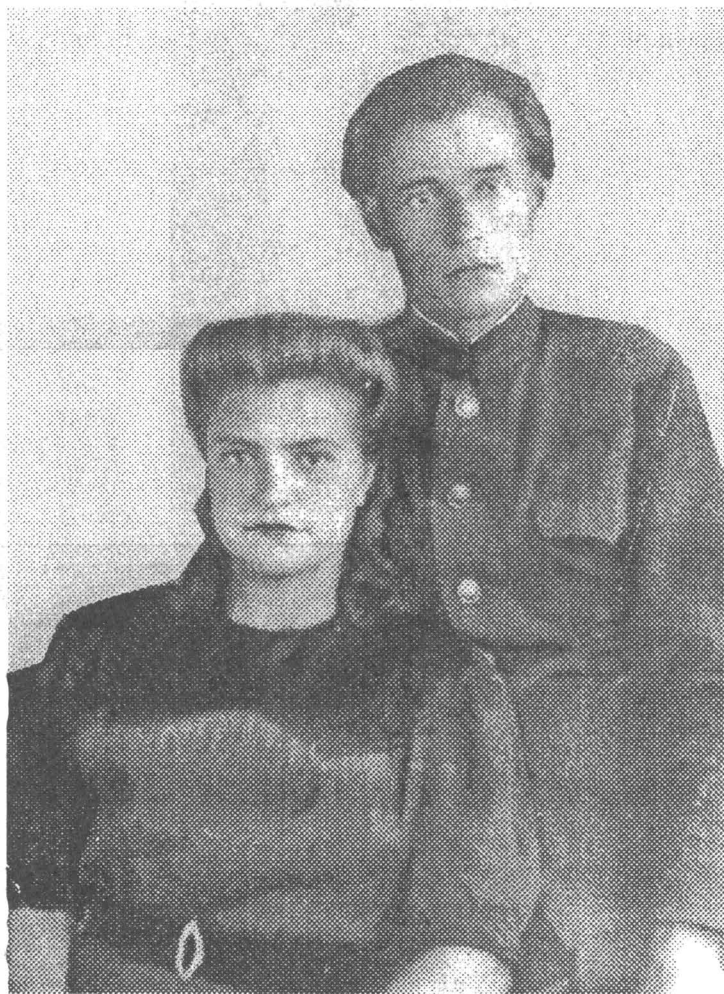
15 июля 1946 года, г.Владимир. Перед свадьбой.