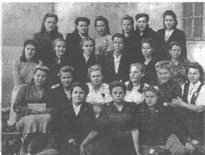
Курсы учителей литературы при Мишкинском педучилище.