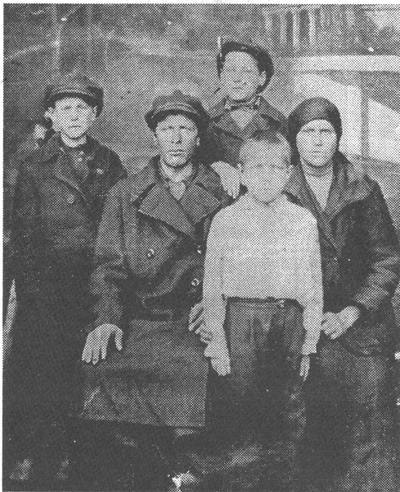
Моя семья 1933 год, г.Прокопьевск