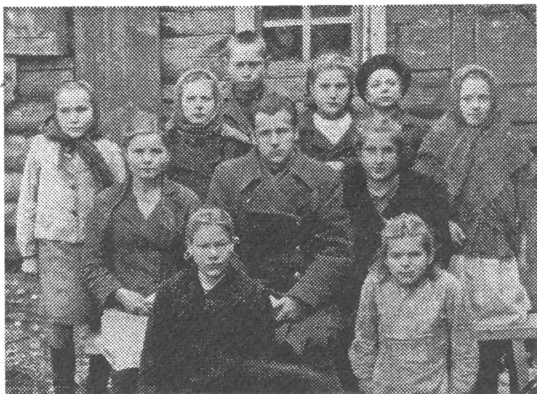
Мой первый класс (6-ой). Островнянская школа № 7 Мишкинского района, Курганской области.