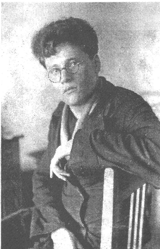
Сталинское педучилище, 2-ой курс, 1938 год.